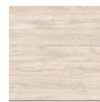
MI13 Encino Polar