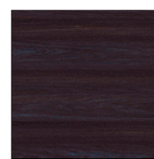
MI12 Ebano boreal